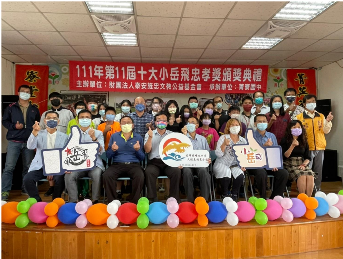
第十一屆小岳飛十大孝行獎頒獎典禮實際支出表